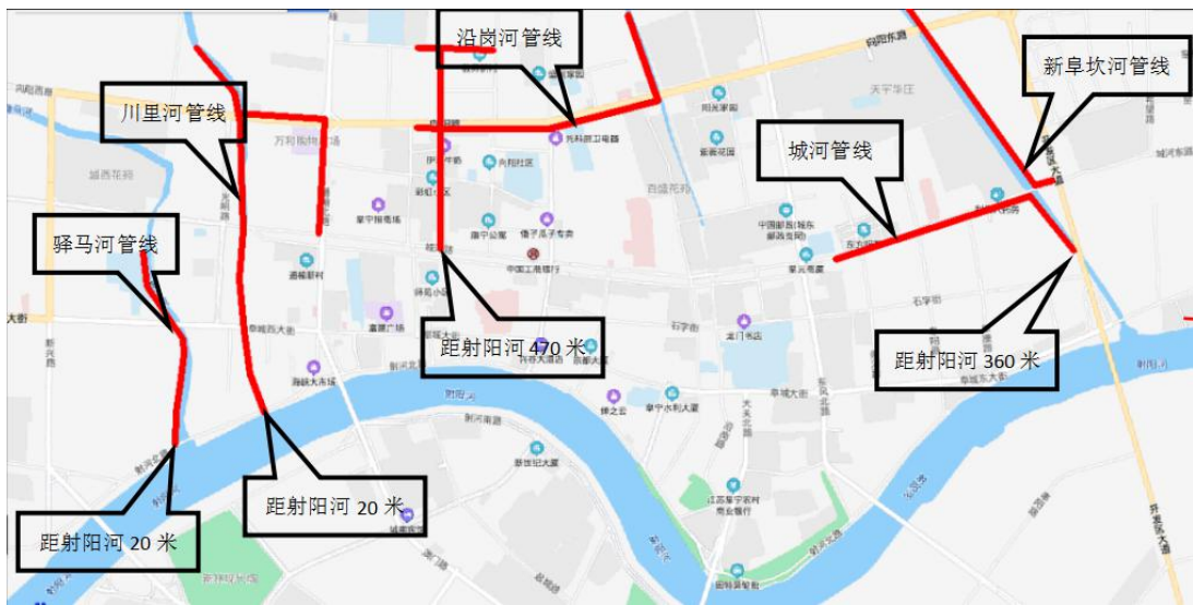
图 2-1 总平布置图

在沿岗河西岸新建公称直径 400 污水管，起点为城北大沟南侧居民点处，终点为向阳路，坡度为 1.5‰，污水管收集沿岗河西岸地块生活污水以及截留污水排口污水。在向阳路北侧新建公称直径 400 污水管，起点为汇源大桥，终点为胜利路，坡度为 1.5‰；新建公称直径 600 污水管，起点为胜利路，终点为彩虹路，坡度为 1‰，在彩虹路西侧新建公称直径 600 污水管，起点为向阳路，终点为城河路，坡度为 1‰；在向阳路北侧新建公称直径 400 污水管，起点为通榆北路，终点为彩虹路，坡度为 2‰；在汶通路北侧新建公称直径 400 污水管，起点为通榆北路，终点为彩虹路，坡度为 2‰；在汶通路北侧新建公称直径 400 污水管，起点为汶河路，终点为彩虹路，坡度为 2‰；在彩虹路西侧新建公称直径 400 污水管，起点为汶通路，终点为向阳路，坡度为 2‰。新建 97 座污水检查井和 1 座截流井。